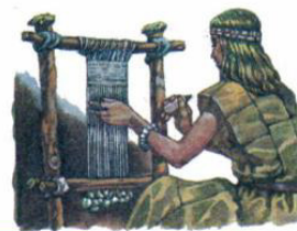
Древнейший ткацкий станок. Реконструкция

ки — люди, которые создавали орудия труда, оружие, посуду. Ремесленники обычно не занимались сельским хозяйством, а получали продукты в обмен на свои изделия. Произошло отделение ремесла от земледелия и скотоводства.