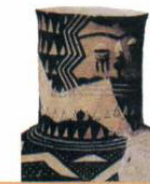
Сосуд в виде человеческой головы. Период неолита

Нити для ткачества скручивали из шерсти животных, из льна и конопли. Для этого была изобретена прялка .